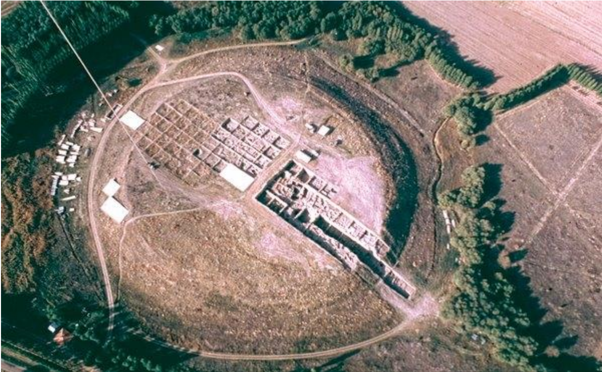
Kaman-Kalehöyük Kuşbakışı Görünüm

Kırşehir Hititlerin yerleşim yeri olan Kızılırmak yayı içinde olduğundan, Hititler döneminin Kırşehir'de yaygın bir şekilde yaşandığı kesindir. Kale Hüyük'te yapılan kazılarda yerleşim alanının en alt tabakasını Hitit döneminin teşkil ettiği ortaya çıkmıştır. Bu kazılar sırasında erken ve geç Hitit çağlarına ait kalıntı ve eserler gün ışığına çıkarılmıştır. Resmi veya saray yapılarına ait olduğu sanılan duvar temelleri ile mühürler, takılar, seramik mutfak eşyaları ve Hitit çapına ait çivi yazılı bir tablet parçası da bulunmuştur.