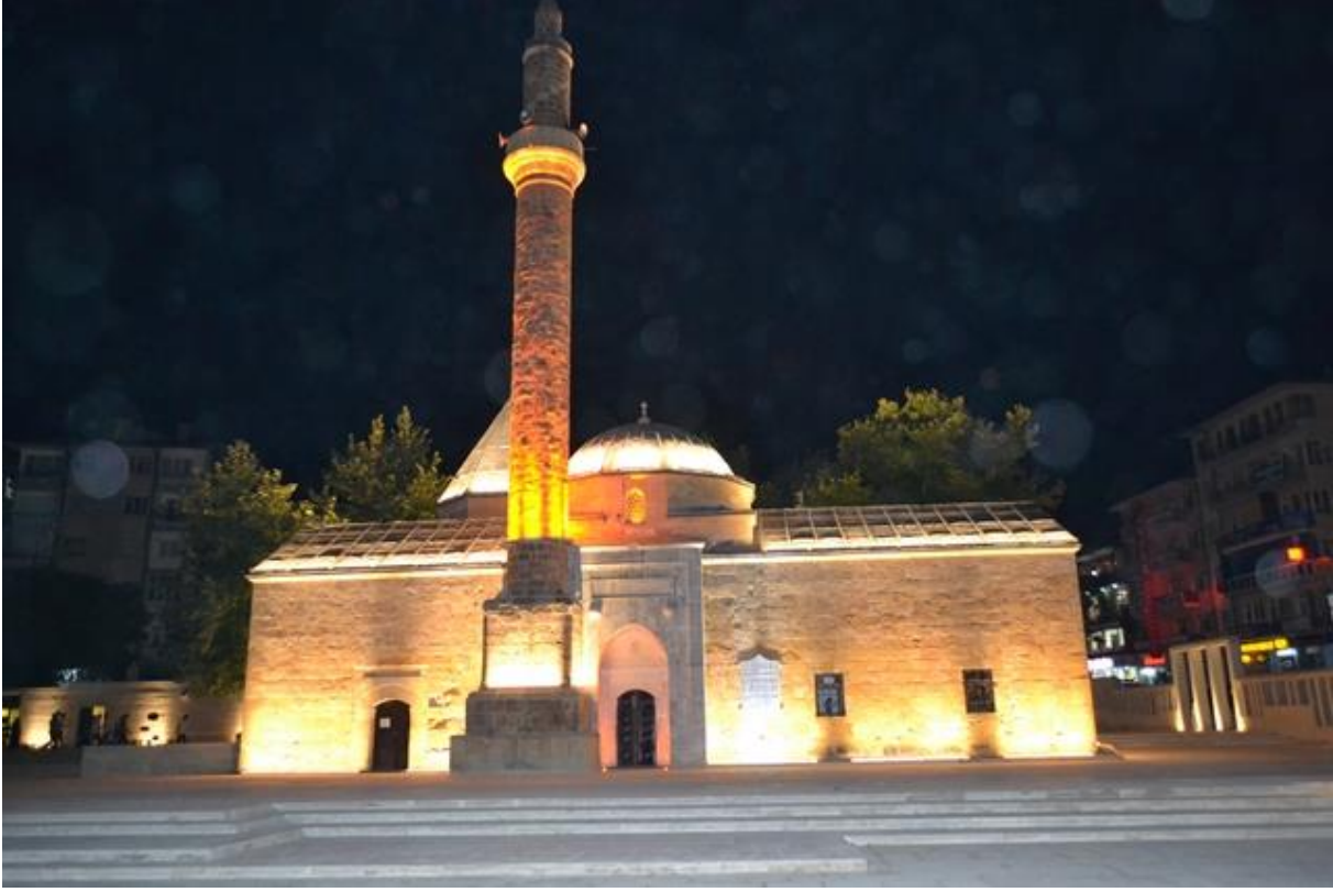
Ahi Evran Camii