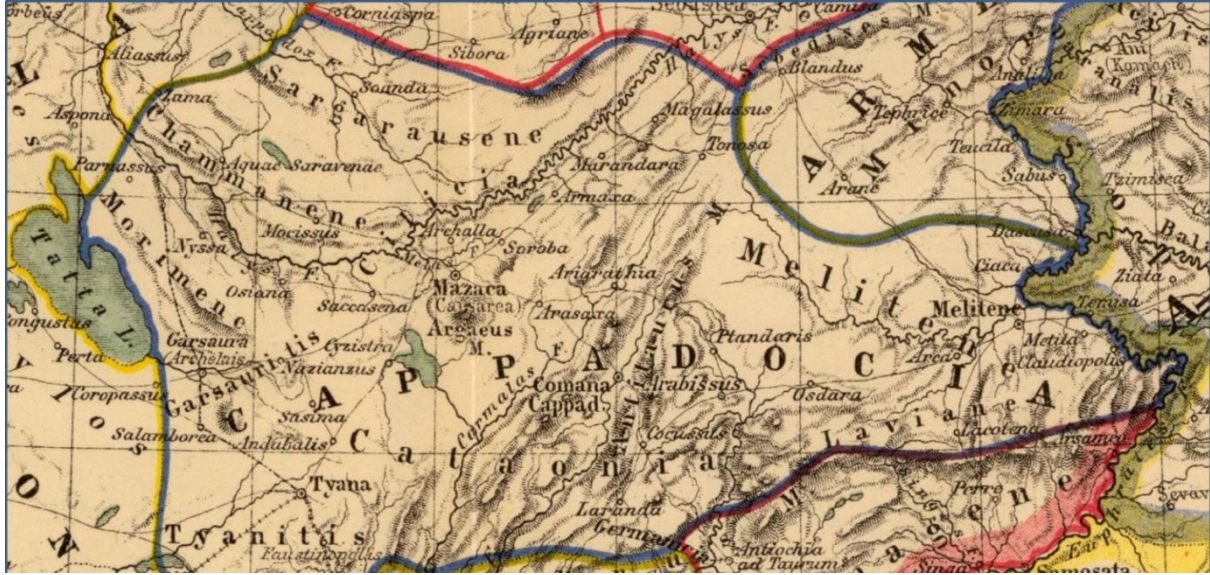
Kapadokya Krallığı Haritası

Kapadokya (Cappadocia) krallığı M.Ö. 333'de kurulmuştur. Bu krallık döneminde Kırşehir ve yöresi yoğun bir baskı yaşamıştır. Komutan Evmenes ve Antipatos dönemleri ise bu kişilerin Kapadokya bölgesini ele geçirme istekleri yüzünden savaşlarla geçmiştir. Büyük İskender'in ordusunu yenilgiye uğratan ii. Ariarates ise Kırşehir'in kuzeyine egemen olmayı başarmıştır. Daha sonra bu bölge toprakları Orta Avrupa'dan Galat (Kelt) topluluklarının akınına uğramıştır. (M.Ö. 220-163) M.Ö. II. yy. sonlarında Pontus Kralı Mithradaset buraları denetimine almıştır. Bu dönemde yöre "Aquaesaravenea" adıyla anılıyordu.