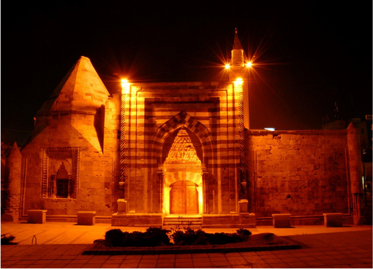
Cacabey Gök bilim Medresesi

Cacabey, Türk halkını koruması, yüksek bir ahlaka sahip olması özü-sözü pek biri olması dolayısıyla Anadolu' da çok sevilmiştir. Öz Türkçe konuşup Türk kültürünün ve eserlerinin Kırşehir ve Anadolu'ya yayılmasına öncülük etmiştir. Cacabey XIII. Yüzyıl da Anadolu'da yaşamış olan diğer Türk büyüklerinden Hacı Bektaşî Veli, Mevlana Celalettin-i Rumi ile de görüşmüş, hatta onların övgülerine bile mahzar olmuştur.