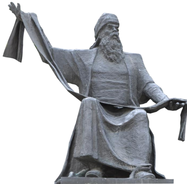
Ahi Evran-ı Veli

Doğum ve ölüm tarihleri kesin bilinmemektedir. Batı Azerbaycan tarafından bulunan Hoy kasabasında doğmuştur. Ahilik teşkilatının kurucusu olan bu büyük zat zamanın en büyük âlimlerinden Fahreddin-i Razi hazretlerinin derslerine devam ederek çeşitli ilim dallarından zahiri ilimleri öğrenmiş, diğer taraftan da Ahmet Yesevi hazretlerinin talebelerinden tasavvuf ve gönül ilmini almıştır. Kısa sürede manevi olgunluklar ve yüksek derecelere ulaşmış, tefsir, hadis fıkıh, kalem ve tıp ilimlerinde derin bir âlim ve büyük bir veli olmuştur.