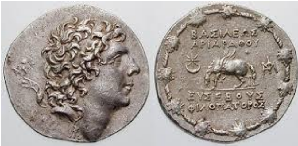
Kapadokya Kralı Ariarates Adına Basılmış Sikkeler

Med Devleti, M.Ö. 550'de Persler tarafından yıkılmış ve ardından Anadolu Pers hâkimiyetine girmiştir. Kırşehir, Perslerin Katpotukya (Kapadokya) yani "Güzel Atlar Ülkesi" adını verdikleri bölgenin batısında yer alıyordu. Persler, vergi yoluyla yöreye hâkim olmuştur. Yöre halkı ise, ağır vergiler altında ezilince çeşitli kaleler yapmak zorunda kalmıştır. Kırşehir ise bu çabaya girmemiştir. Çünkü toprakları çok kıraçtı. Persler ise M.Ö. 334'de Büyük İskender'in ordusuna yenildiler ve Makedonlar Kırşehir'i ele geçirdiler. Yöre halkının ayaklanmasından sonra Kapadokya kralı olarak M.Ö. 332'de Ariarates bağımsızlığını ilan etmiştir.